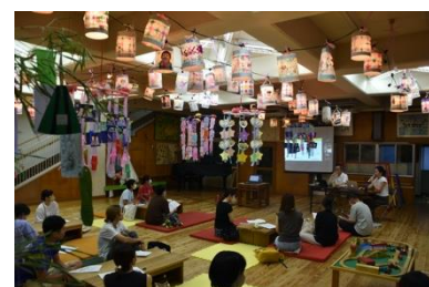
7/6 保育情勢学習交流会

3日(木) AM 心の育ちをつなぐ保幼小連携 In たかつかさ保育園 園見学 12日(土)～17日(木) 特別保育期間(15・16日 要お弁当) 21日(月)～30日(水) プール参観(幼児クラスのみ) 24日(木) 避難訓練