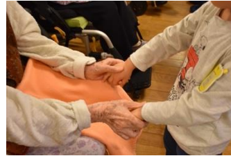
健光園の皆さんとの交流

10月17日(木)9:45 給食室から出火想定で避難しました。前回消防隊員さんからの指導も振り返りながら行い2階からの避難時にトイレなどの最終避難確認も適切にできていました。