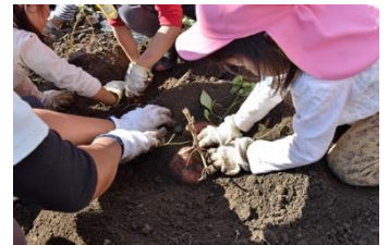
洛星中学校の畑をお借りして 芋掘り